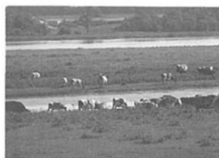
表紙写真