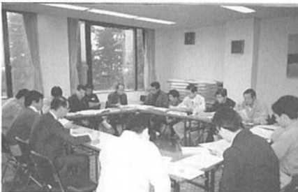
▼情報発信チームの検討会

今後の東川農業の発展のために、総合支援システムとして機能していく「農業振興センター」（仮称）を計画している。必要な機能の概要は①担い手育成、②農作業委託、③農地流動化、④リース農場、⑤研究・普及事業等を考えているが、農業振興センターの実現に向けた検討委員会を設置し、年次的に設置していくこととしている。