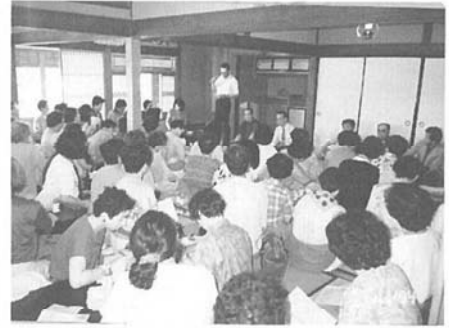
▲特別栽培米の消費者と産地交流会

今後の産地間競争激化の中で、東川産の農産物の安定生産・安定販売のためには「東川農産物の総ブランド化」を進め、それら情報を広く、しかも適確に発信してい