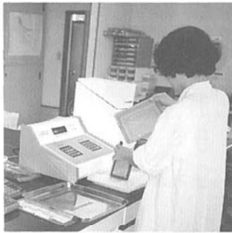
▲米の食味分析器を導入し全町の食味向上をねらう