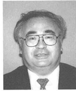
北海道地域農業研究所 研究部長