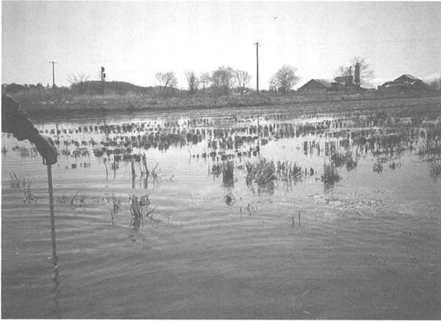
写真2 手前が地盤が沈下して滞水している水田