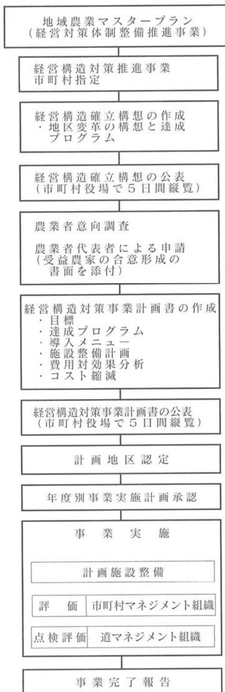
図2 経営構造対策の実施手続き